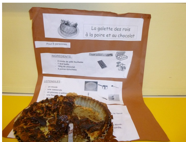
Galette à la poire et au chocolat