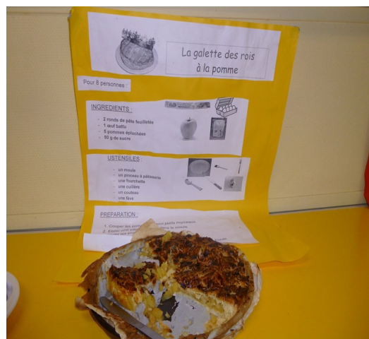
Galette à la pomme