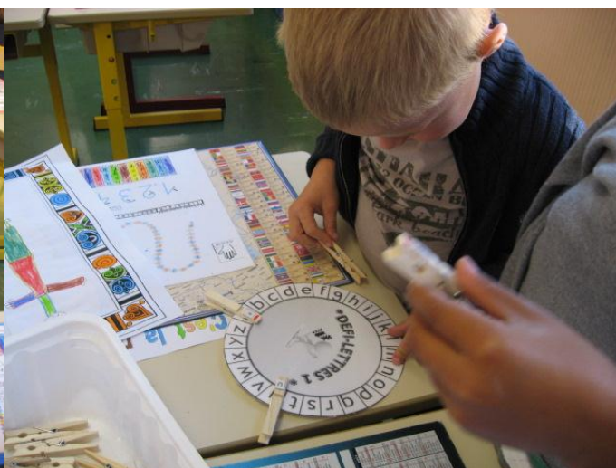
Le défi-lettres : correspondances