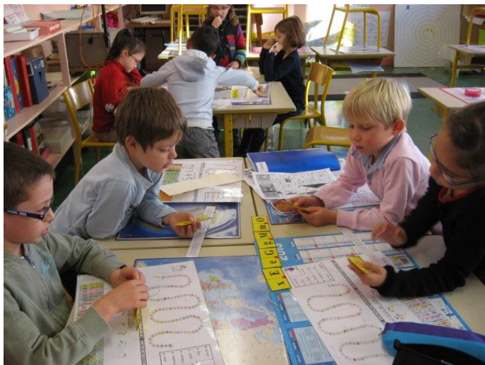
Les dominos (correspondance script majuscules et minuscules)