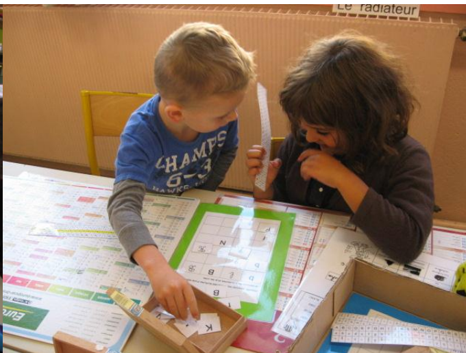
Les costumes des lettres