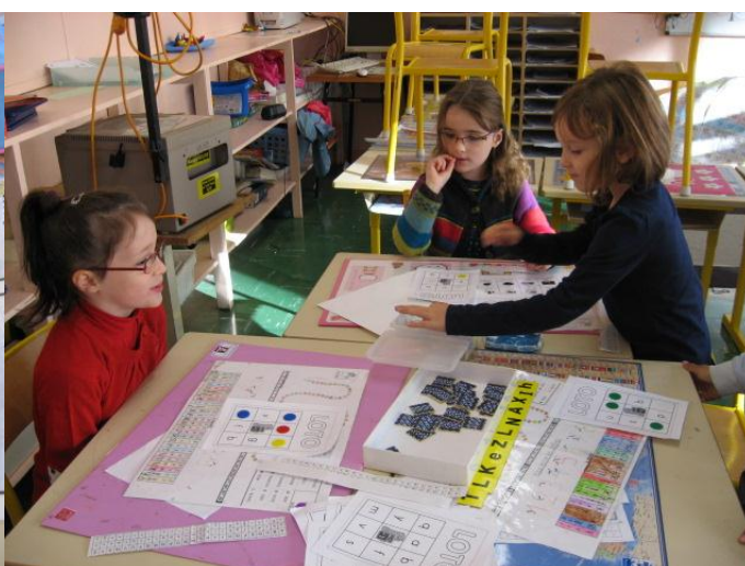
Le loto des lettres : correspondances