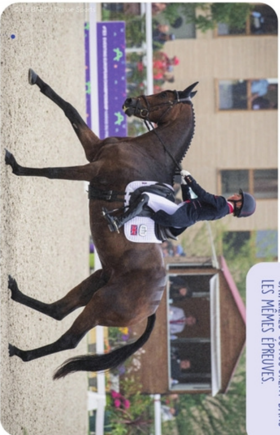
La cavalière britannique Rosalind Canter , sur Lordships Graffalo , a terminé deuxième du dressage.

Tout commence par l'épreuve de dressage. Le couple cavalier-cheval doit effectuer une vingtaine de figures au cours d'un exercice qu'on appelle reprise .