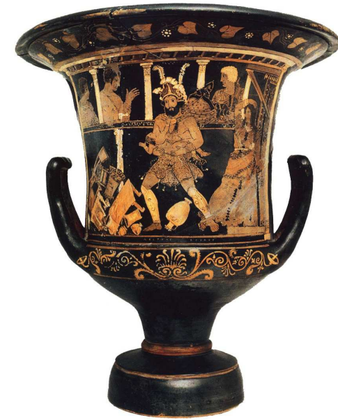
La folie d'Héraclès, en présence de Mégara, Iolaos, Alcmène et Mania (divinité personnifiant la folie) ("Cratère de Madrid" Face A, par Astéas, v. 340 av. J.-C.)