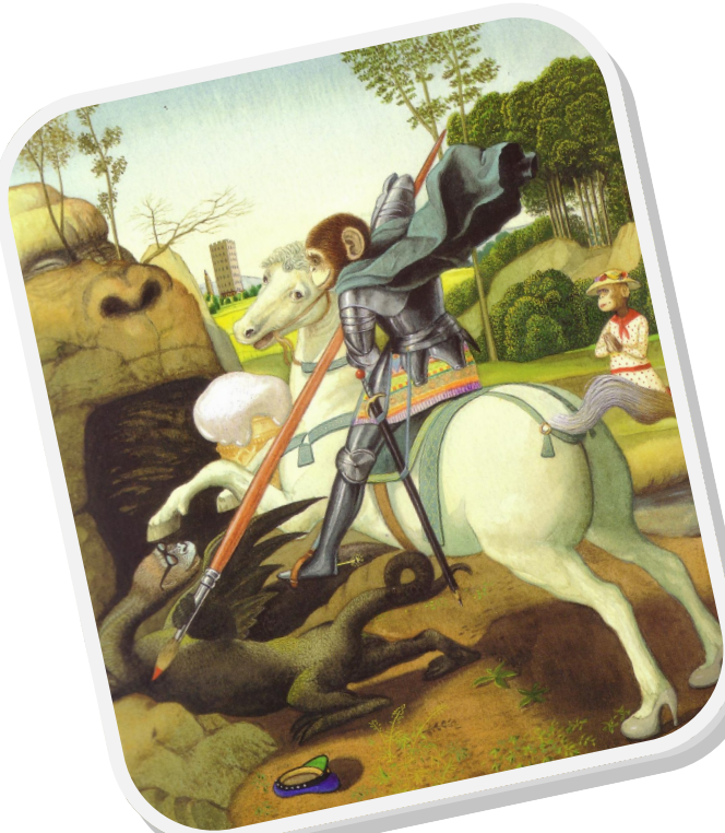
Saint-Georges et le dragon (1460)

Sa biographie: Raphaël (1483–1520) est un peintre et architecte italien de la Renaissance. Il a longtemps été considéré comme le plus grand peintre qui n'est jamais existé. Il a été influencé par Léonard de Vinci et Michel-Ange qui achèvent sa formation. Ses dessins sont très précis ainsi que les couleurs choisies. Il peint également des œuvres religieuses, comme Saint-Georges et le dragon . Le courageux Saint-Georges sauve la fille du roi en terrassant le dragon qui terrorisait la ville.