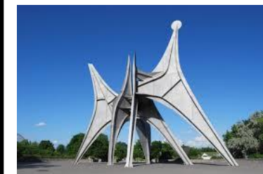
L'homme de Calder, 1967, 24 m , acier inoxydable, Montréal