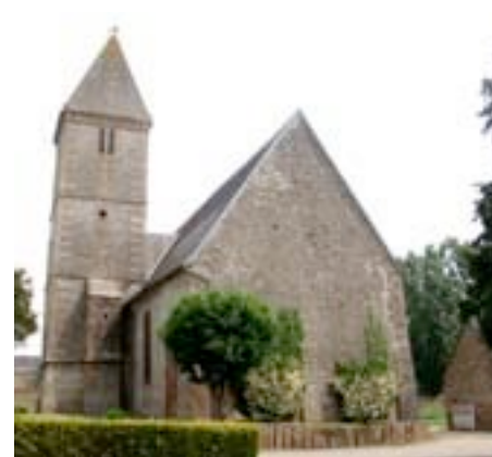
église Saint-Denis de Cuves #

Tous nous sommes invités au festin des nocces de ton Fils, Seigneur. Accorde-nous d'être assez pauvre pour accepter ton invitation avec reconnaissance et grande joie et d'être reconnu digne de pouvoir y participer.