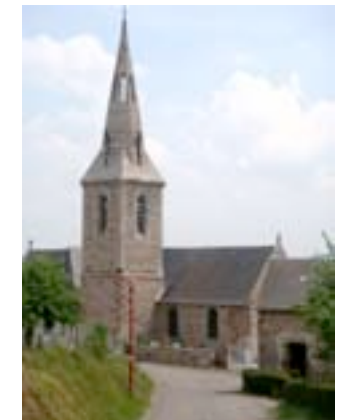
église St-Gerbold du Petit-Celland

Paroisse : Saint-Martin tel : 02 33 48 71 47