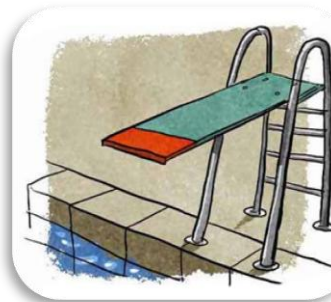
un g plongeoir