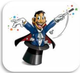
un g agicien