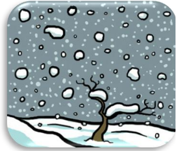
la g eige