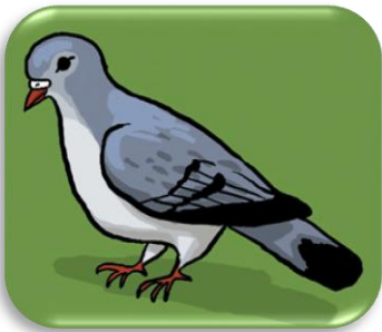
un g igeon