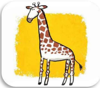
une g irafe

J'écris aussi g devant i ou e Ou j'écris aussi ge devant a ou o .