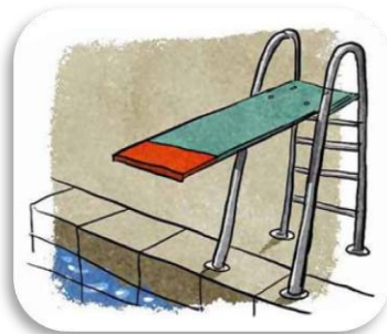
un g plongeoir