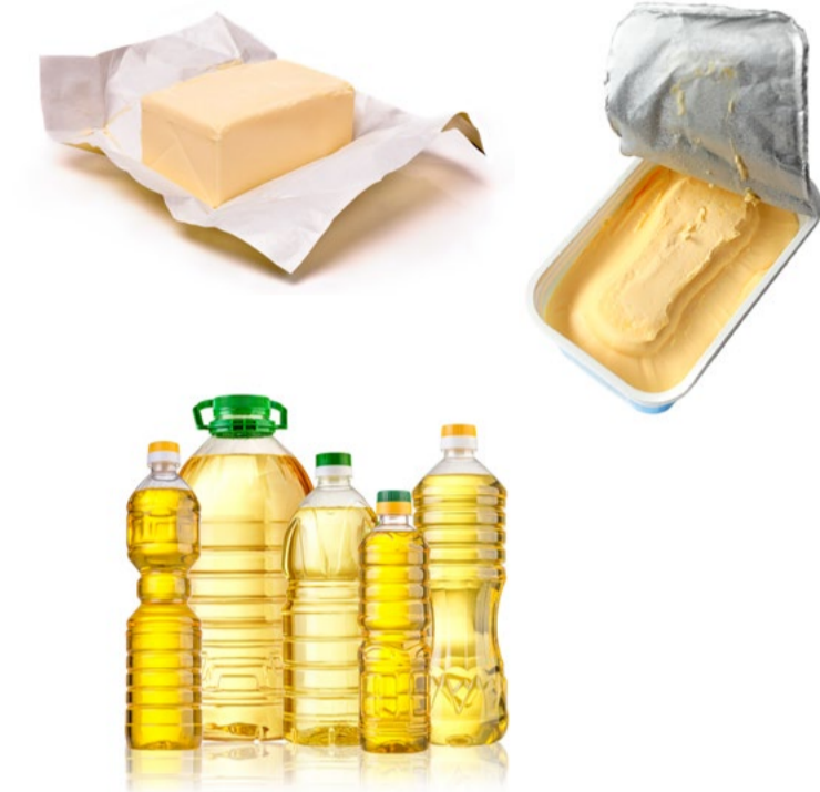
LES MATIÈRES GRASSES