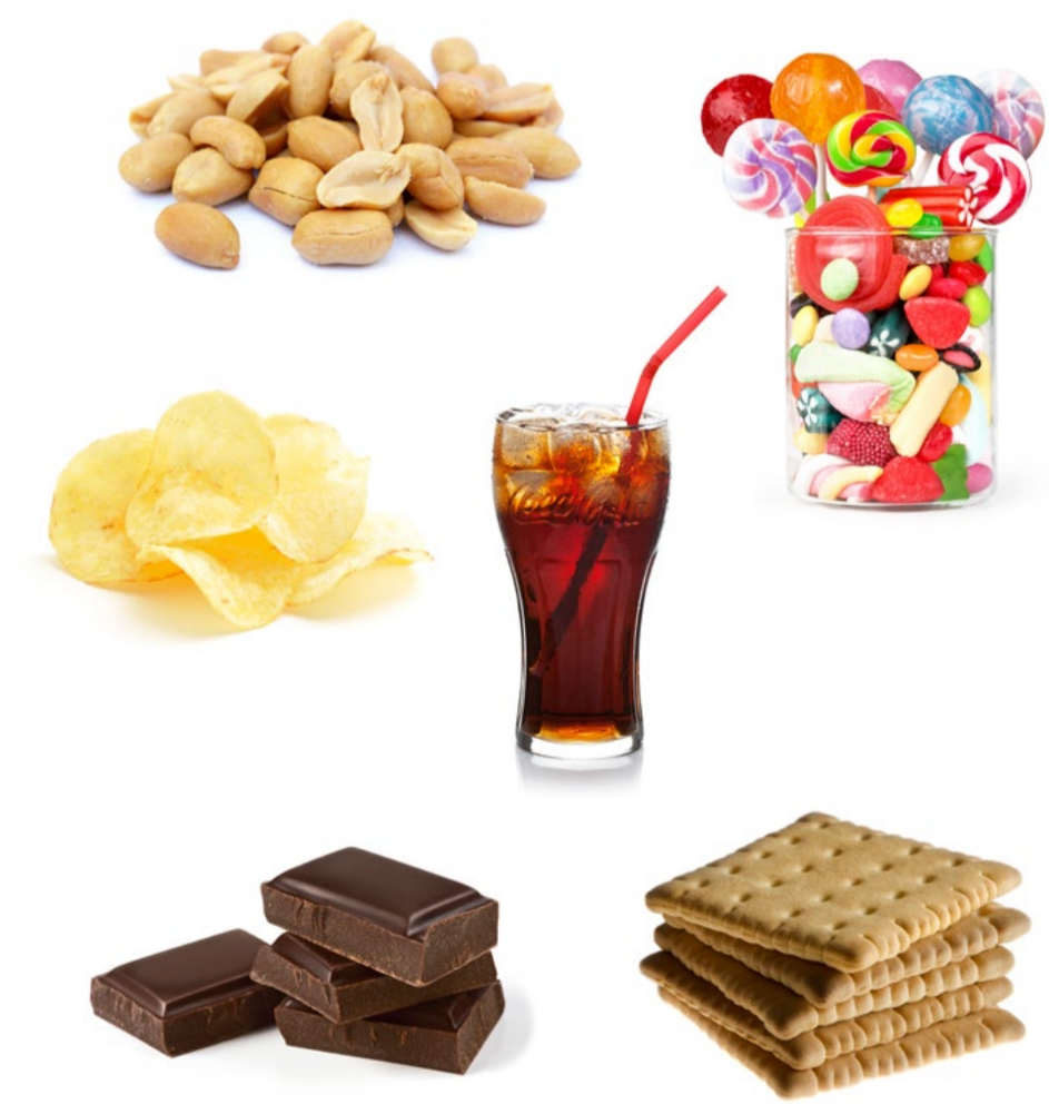
LES ALIMENTS PLAISIR