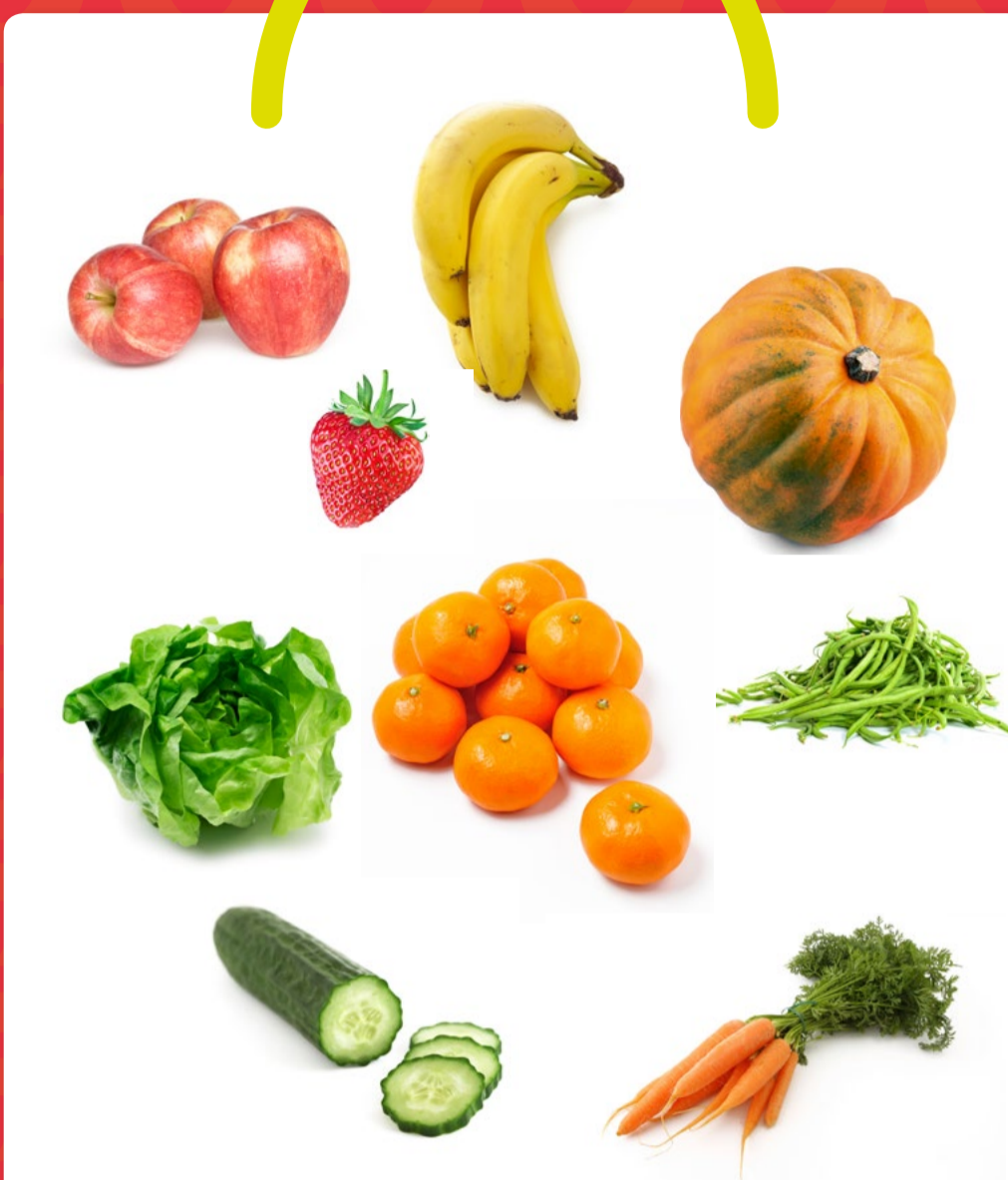
LES FRUITS ET LÉGUMES