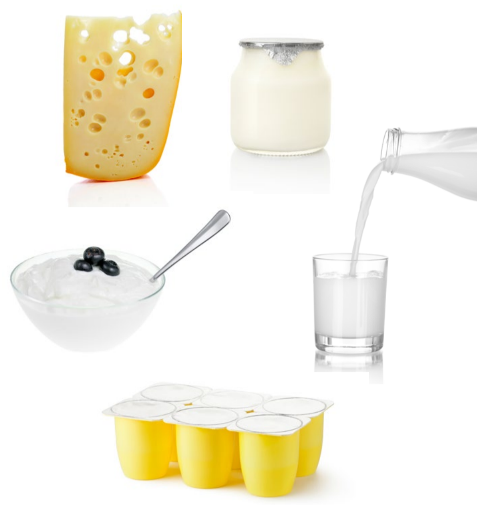
LES PRODUITS LAITIERS