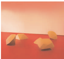
Delphine Coindet, Les pierres précieuses, 1994. Coll FRAC Poitou-Charentes