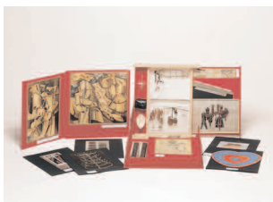
Marcel Duchamp, Boîte en valise, collection FRAC Poitou-Charentes

Contemporain Poitou-Charentes autour d'une de ses pièces maîtresses, une boîte en valise de Marcel Duchamp, rarement montrée depuis son acquisition en 1988.