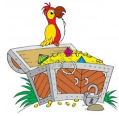
un tr é sor