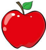
une p o mm e