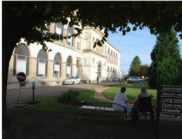
C'est le bâtiment historique de l'hôpital charollais qui abrite les cuisines.

Les raisons : de part leur ancienneté et celle du bâtiment qui les abrite, les cuisines ne répondent plus tout à fait à certaines normes actuelles. Exemple, du fait de sa petite taille, coins plonge et cuisine n'ont pas pu être distingués et des travaux seraient difficiles. Mais direction comme syndicats insistent, aucun problème sanitaire n'est jamais venu