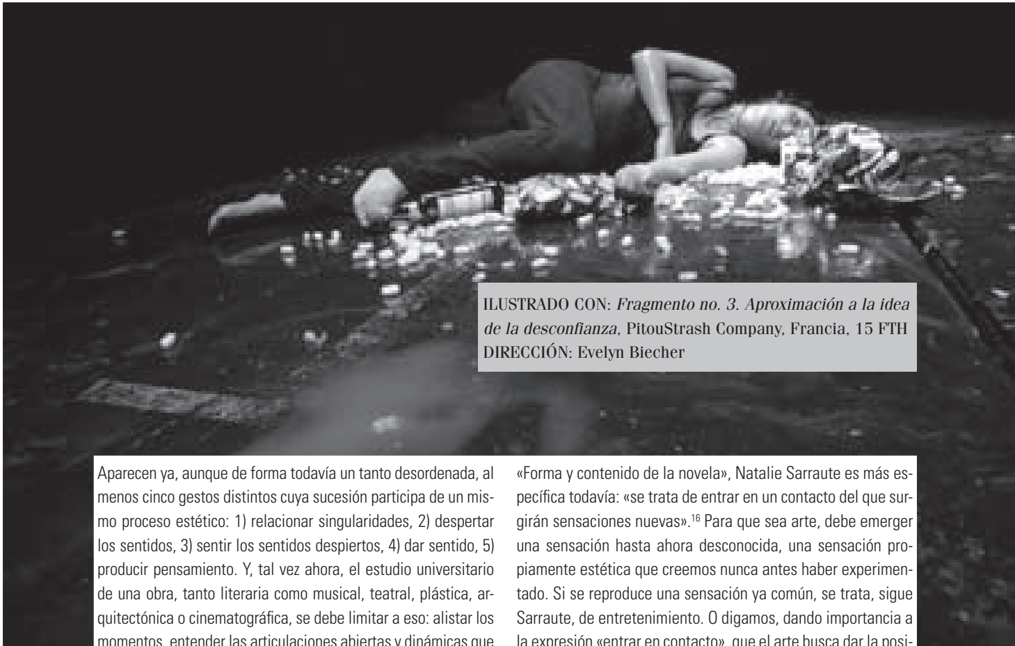
ILUSTRADO CON: Fragmento no. 3. Aproximación a la idea de la desconfianza , PitouStrash Company, Francia, 15 FTH DIRECCIÓN: Evelyn Biecher

Aparecen ya, aunque de forma todavía un tanto desordenada, al menos cinco gestos distintos cuya sucesión participa de un mismo proceso estético: 1) relacionar singularidades, 2) despertar los sentidos, 3) sentir los sentidos despiertos, 4) dar sentido, 5) producir pensamiento. Y, tal vez ahora, el estudio universitario de una obra, tanto literaria como musical, teatral, plástica, arquitectónica o cinematográfica, se debe limitar a eso: alistar los momentos, entender las articulaciones abiertas y dinámicas que conducen de la composición estética por el artista a la producción de pensamiento en el espectador. Es otra vez la cuestión del cómo . ¿Cómo analizar lo que transcurre desde el momento en que el artista piensa en hacer una obra hasta el momento en que el espectador, después de haber visto la obra hecha, está pensando —del pensar de uno al pensar de otro?