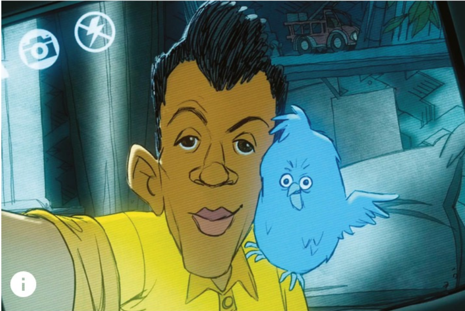
Image du clip de la chanson Carmen de Stromae, réalisé par Sylvain Chomet (2015)

https://www.youtube.com/watch?v=UKftOH54iNU