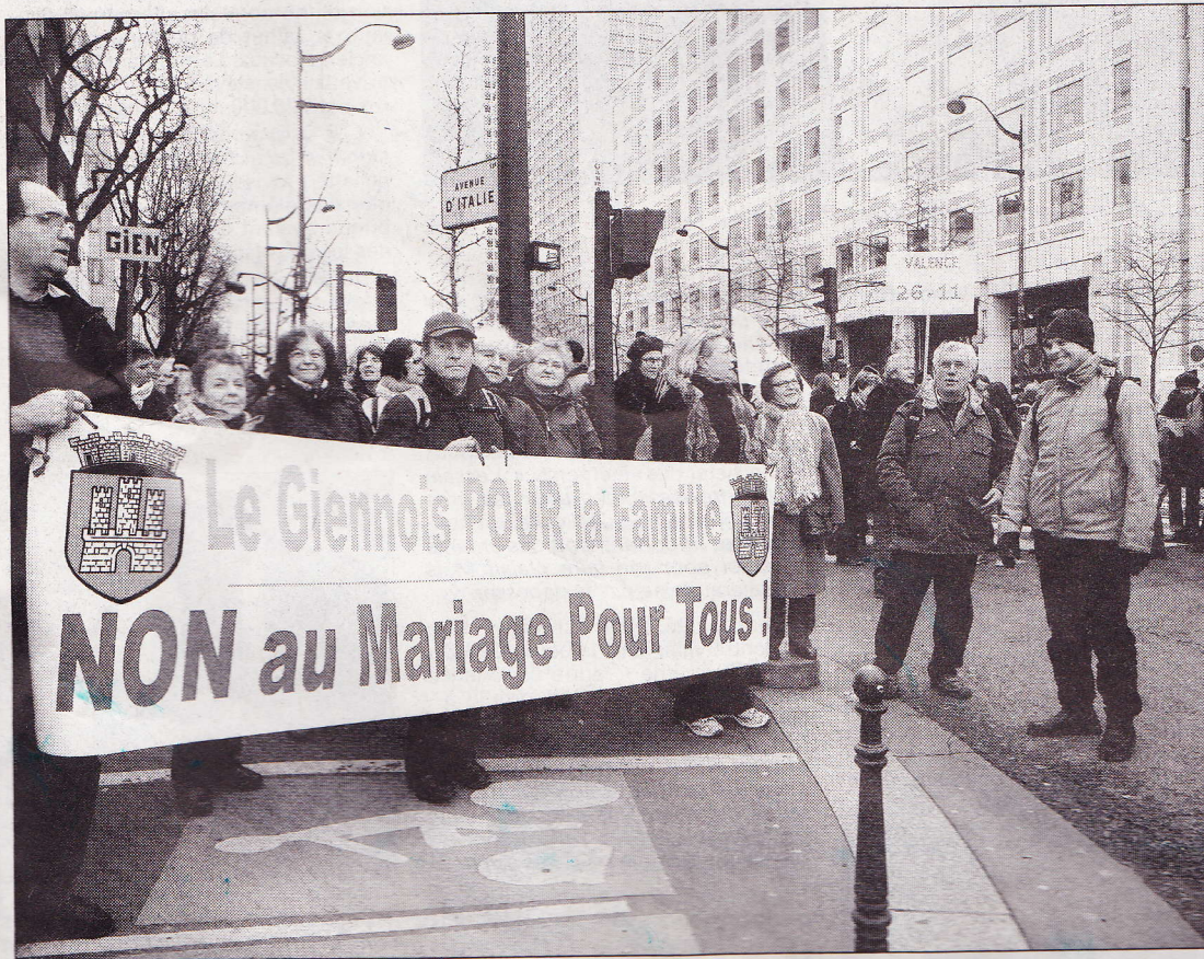
Tous les Giennois et les Briarois se sont retrouvés au départ de la place d'Italie pour défilé ensemble vers le Champs de Mars

La balle est maintenant dans le camp du gouvernement.