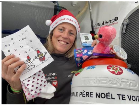
25 décembre 2020 Du bonheur à bord d'Initiatives-Coeur!! Le vent est revenu, le soleil est sorti, ET le Père Noël est passé !