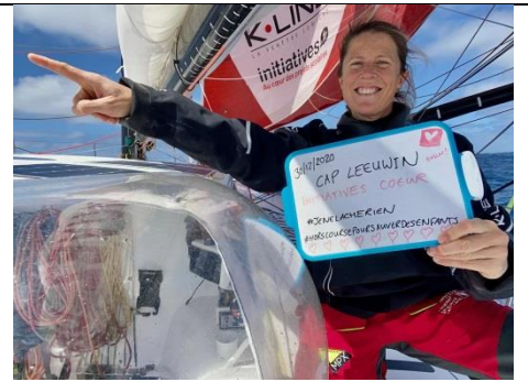
30 décembre 2020 J'ai enfin réussi à passer le cap Leeuwin !