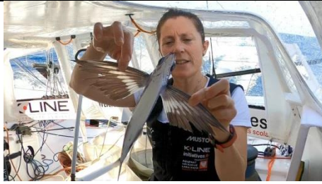
16 novembre 2020 Rencontre avec les poissons volants.