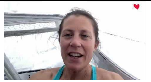
18 novembre 2020 3ème orage dans le Pot-au-Noir