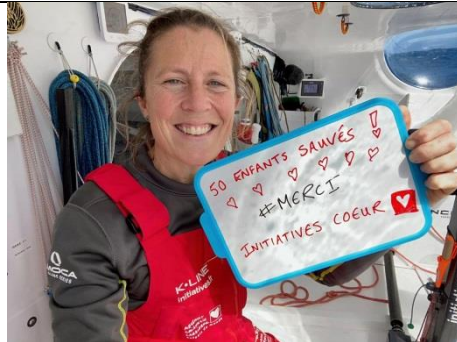
12 janvier 2021 50 enfants sauvés !