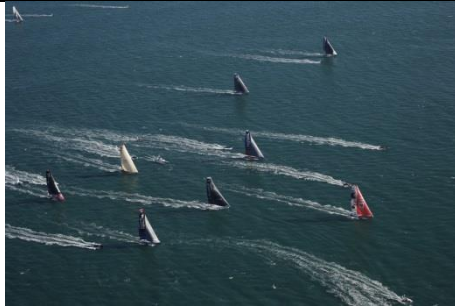
8 novembre 2020 Super départ de Sam !