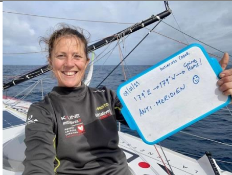
8 janvier 2021 Je suis désormais dans les longitudes Ouest !