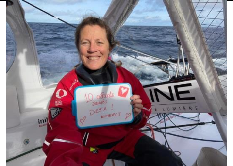
10 novembre 2020 Bonne nouvelle : 10 enfants sauvés !