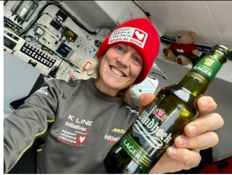
1 er janvier 2021 Happy New Year depuis le grand Sud !