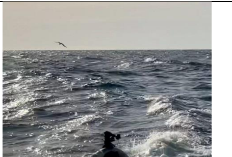
26 novembre 2020 un albatros accompagne Sam !