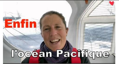
3 janvier 2021/57 ème jour de course. Un océan la sépare du 1er de la course Yannick Bestaven. Ce dernier passe le Cap Horn pour remonter l'océan Atlantique alors que Sam entre tout juste dans l'océan Pacifique.