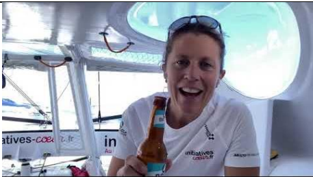
20 novembre 2020 C'est la tradition : passage de l'équateur = offrande au dieu de la mer Neptune