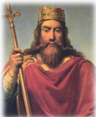
Clovis et la dynastie des Mérovingiens