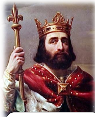
Pépin le bref et la dynastie des Carolingiens