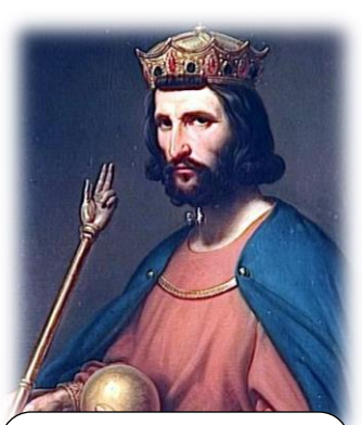
Hugues capet et la dynastie des Capétiens