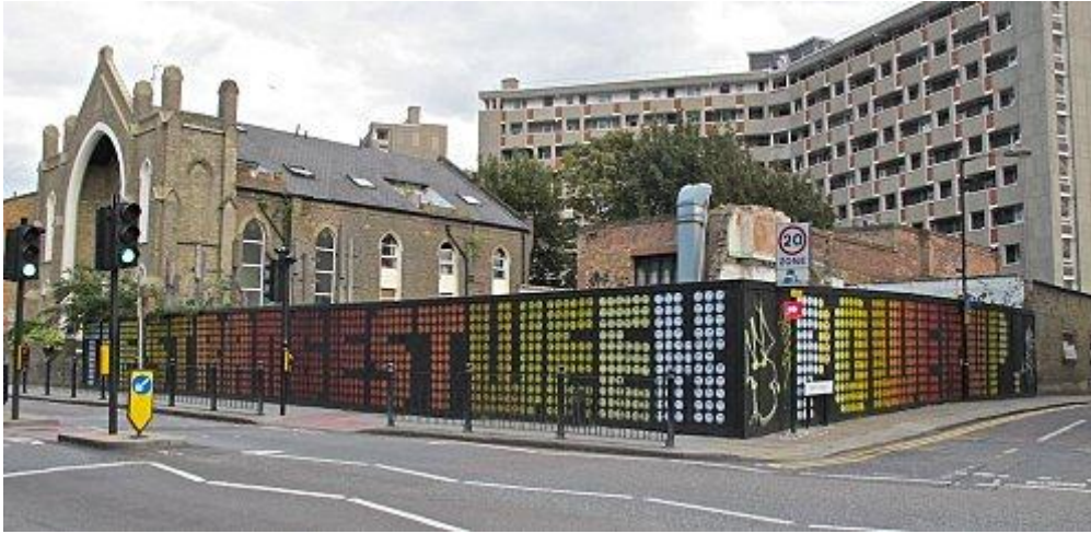
Power up d'Eine, typographie faite de smileys

Après ce coup de projecteur sur son travail, Eine a tranquillement bombé ses pochoirs sur la palissade de Hackney road aidé de quelques amis. L'un d'eux a écrit "Power up" sur Diss street.