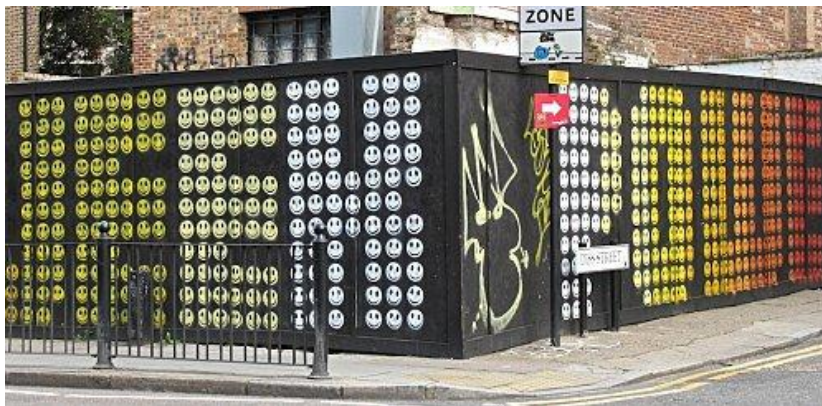
The strangest week d'Eine et power up, typographie faite de smileys