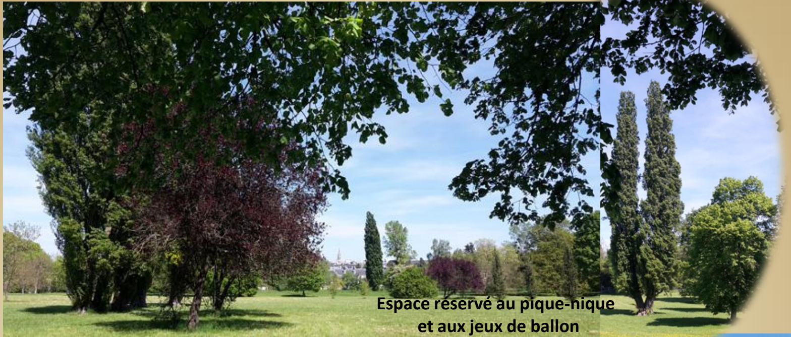
Espace réservé au pique-nique et aux jeux de ballon