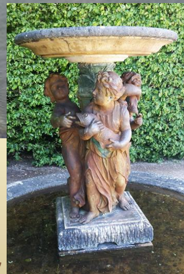
Trois enfants jouant avec des poissons