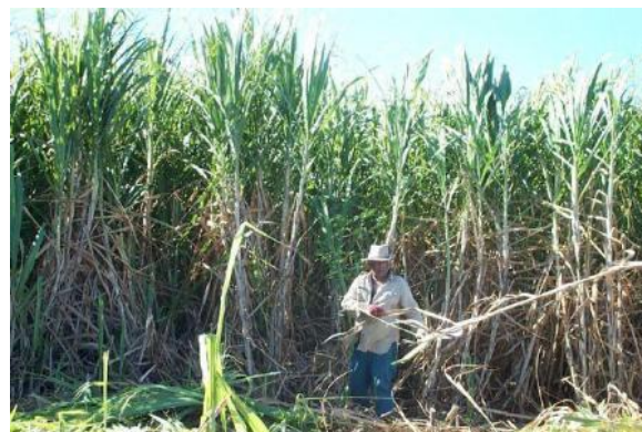
La culture de la canne à sucre