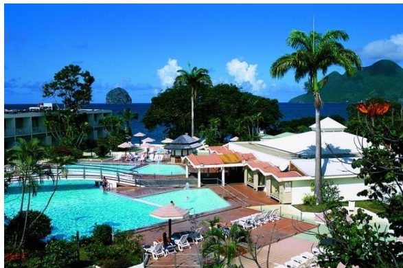
Un centre touristique dans les Antilles