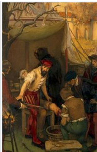
Ambroise Paré utilisant la ligature à Damvillers par Ernest Board (1877-1934).