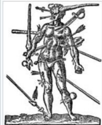
Les blessures de guerre selon Ambroise Paré.