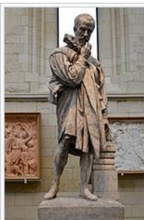
Statue en plâtre d'Ambroise Paré, par David d'Angers, Angers, 1839. (Modèle d'un bronze se trouvant à Laval.)