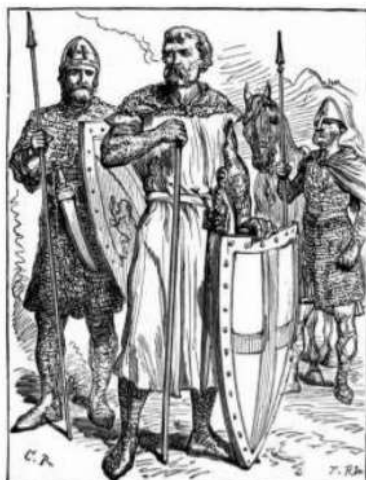
Chevaliers de l'an Mille

La guerre est la principale occupation du seigneur. Que ce soit pour défendre son territoire contre les seigneurs rivaux ou contre le roi de France qui cherche à imposer son autorité, il vit au rythme des batailles. Pour cela, il s'entoure d'hommes de guerres, les chevaliers. On devient chevalier très jeune après la cérémonie de l'adoubement au cours de laquelle le jeune chevalier jure fidélité à la religion et à l'honneur. Il combat à cheval, protégé par sa cotte de maille en fer, son armure et son heaume et armé de sa lance et de son épée.