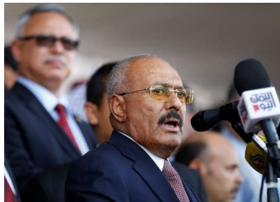
Ali Abdullah Saleh

Fortune estimée: entre 30 et 62 milliards de dollars. Aujourd'hui décédé, il a été Président de la République arabe du Yémen, entre 1978 et 1990. Il aurait profité d'une large fortune tout au long de sa vie, même si son montant exact n'est pas officiellement connu.