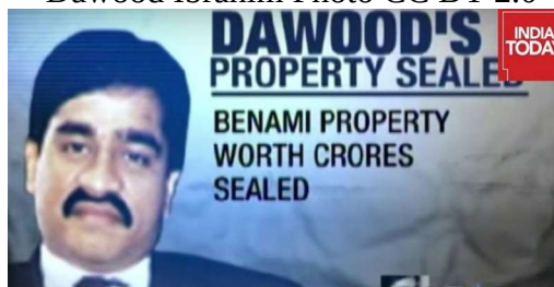
Dawood Ibrahim

Fortune estimée: 6,7 milliards de dollars. Dawood Ibrahim est probablement l'un des plus riches criminels de l'Histoire. Il a fondé la C-Company à Bombay dans les années 1970. Depuis, sa fortune est incalculable. Interpol rappelle que son CV affiche plusieurs crimes.