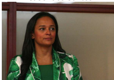
Isabel dos Santos

Fortune estimée: 3,4 milliards de dollars. La femme d'affaires, et fille aînée de l'ancien Président d'Angola, José Eduardo Dos Santos, est aujourd'hui la femme la plus riche d'Afrique. Isabel dos