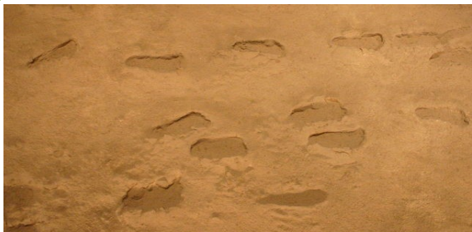
Traces de pas humains, vers 3,6 millions d'années avant J.C.

Son squelette a été retrouvé en Éthiopie en 1974. Elle mesurait environ 1,20 mètre et devait être âgée, à sa mort, de 18 à 20 ans.