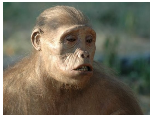
Toumaï, le plus ancien des ancêtres de l'homme (Vers 6 millions d'années avant J.C). Son crâne a été retrouvé au Tchad en 2002.