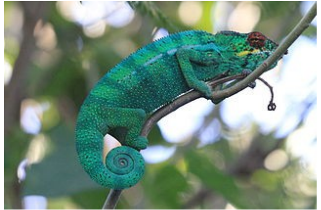
Chameleo pardalis mâle

A La Réunion , il est appelé « l'endormi » car il se déplace très lentement. C'est le Chameleo pardalis . Il a été amené de Madagascar par les premiers habitants au 17 ème siècle.