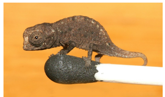
Bookesia micra juvénile

Le bookesia micra est le plus petit caméléon au monde. Il mesure à peu près 3 cm quand il est adulte. On le trouve à Madagascar.