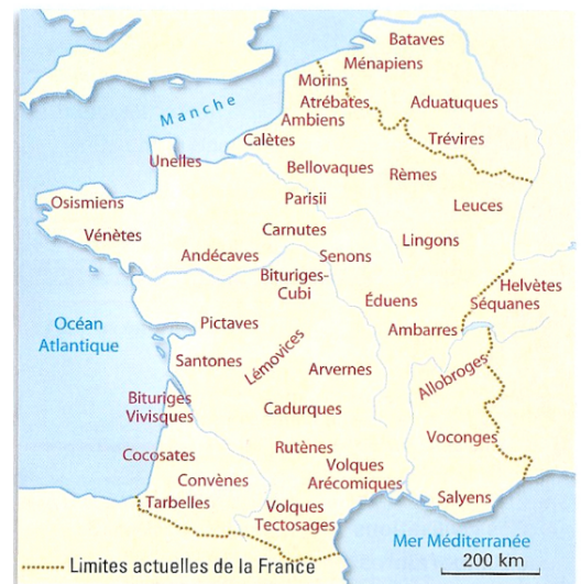
Les principales tribus celtes

Les tribus se font souvent la guerre mais elles savent aussi se Regrouper pour faire alliance contre un ennemi commun. Chaque tribu est indépendante l'une de l'autre. Il n'y a pas d'unité politique.