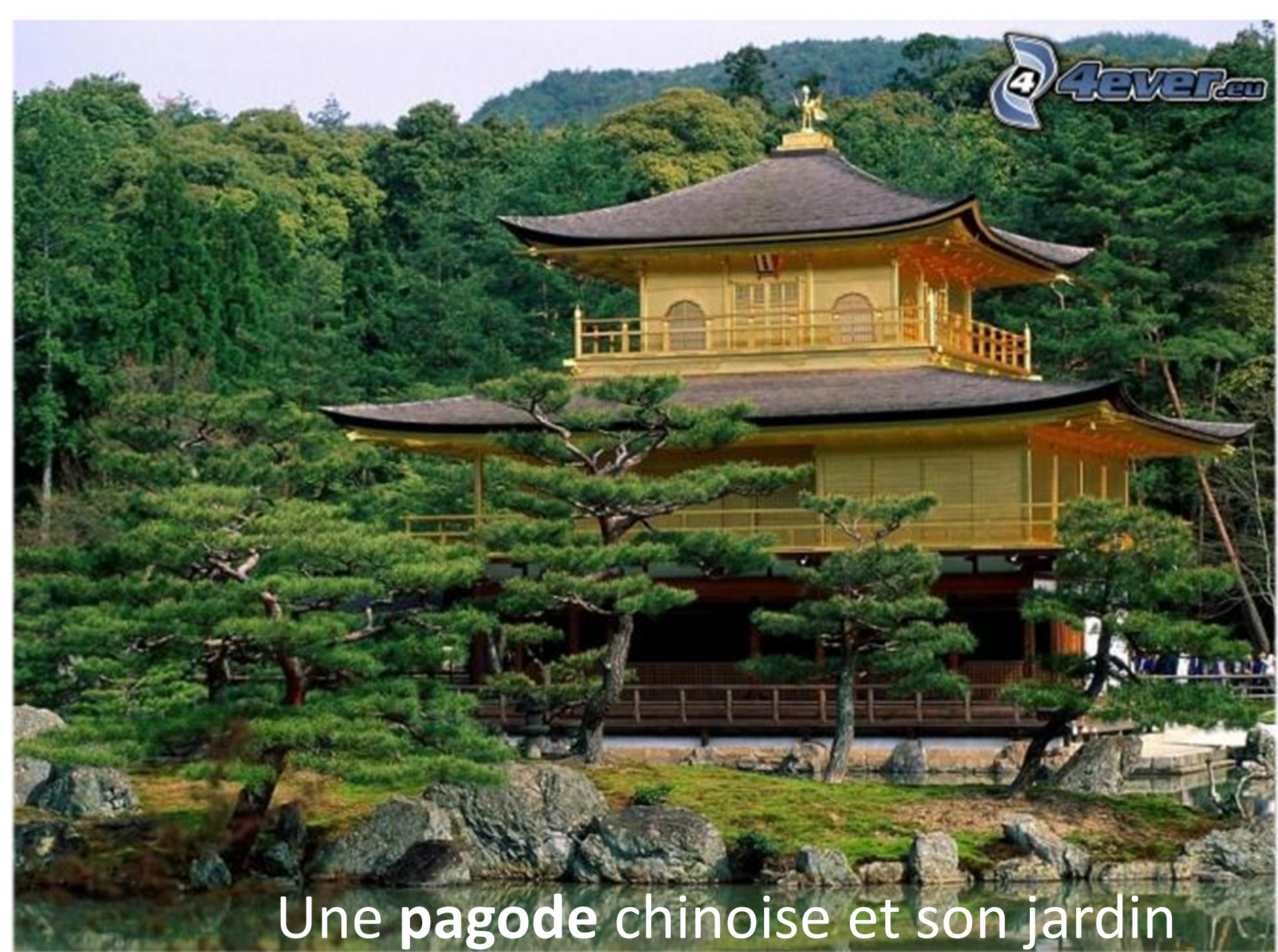
Une pagode chinoise et son jardin