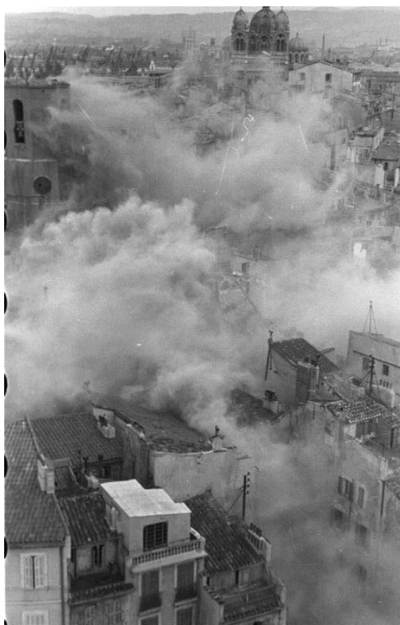
Februar 1943