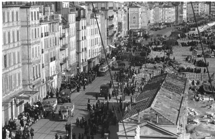
24. Januar 1943