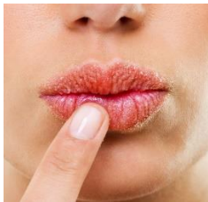
Ceci n'est pas une bouche