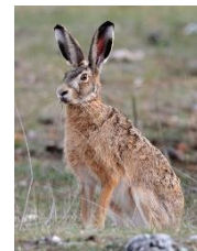
Ceci n'est pas un lapin