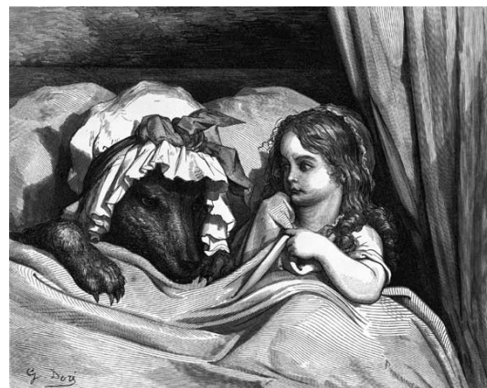
Le petit Chaperon rouge au lit avec le loup. Illustration de Gustave Doré pour Le Petit Chaperon rouge dans Les Contes de Perrault . Paris, Jules Hetzel, 1862.

Pour écrire un dialogue, on met un tiret au début de chaque phrase dite par une personne.