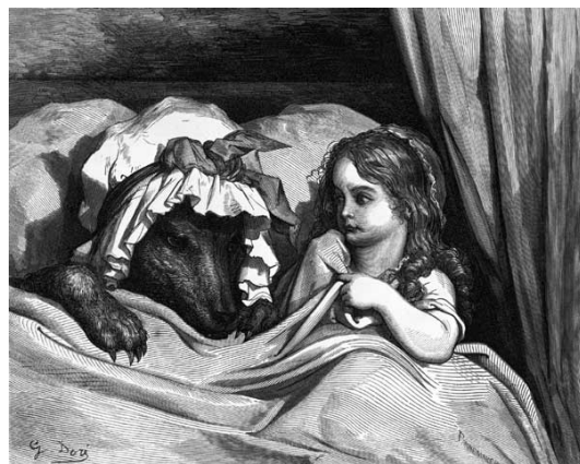
Le petit Chaperon rouge au lit avec le loup. Illustration de Gustave Doré pour Le Petit Chaperon rouge dans Les Contes de Perrault . Paris, Jules Hetzel, 1862.

Pour écrire un dialogue, on met un tiret au début de chaque phrase dite par une personne.