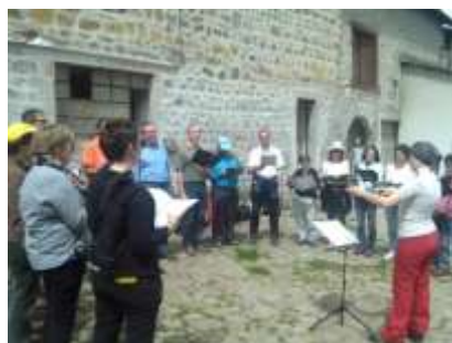
Pause musicale sur le chemin

Cet évènement est organisé depuis de nombreuses années par le MRJC. Des membres d'équipes du CMR viennent chaque année apporter leur expérience à nos jeunes amis.