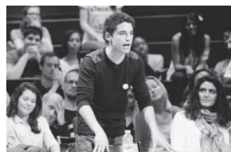
A VOIX HAUTE - LA FORCE DE LA PAROLE

Prendre la parole et donner de la voix pour changer de vie, c'est le sens des concours Eloquentia auxquels participent chaque année