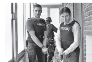
QUE DIOS NOS PERDONE

de Rodrigo Sorogoyen Espagne - 2017 - 2h06 - Vo.st Avec Antonio de la Torre, Roberto Álamo, Javier Pereira Genres : Policier, Thriller