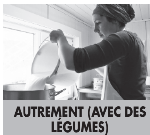
AUTREMENT (AVEC DES LÉGUMES)

Profondément bouleversé par ces témoignages, il fait une pause et rencontre dans un parc une étrange jeune femme, Michiko. Petit à petit, il se laisse porter par la gaieté de Michiko et décide de la suivre pour un voyage improvisé à travers la ville, jusqu'à la mer.