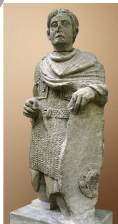
Statue d'un gallo-romain