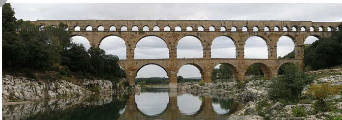
Le Pont du Gard, Ier siècle ap. J.-C.