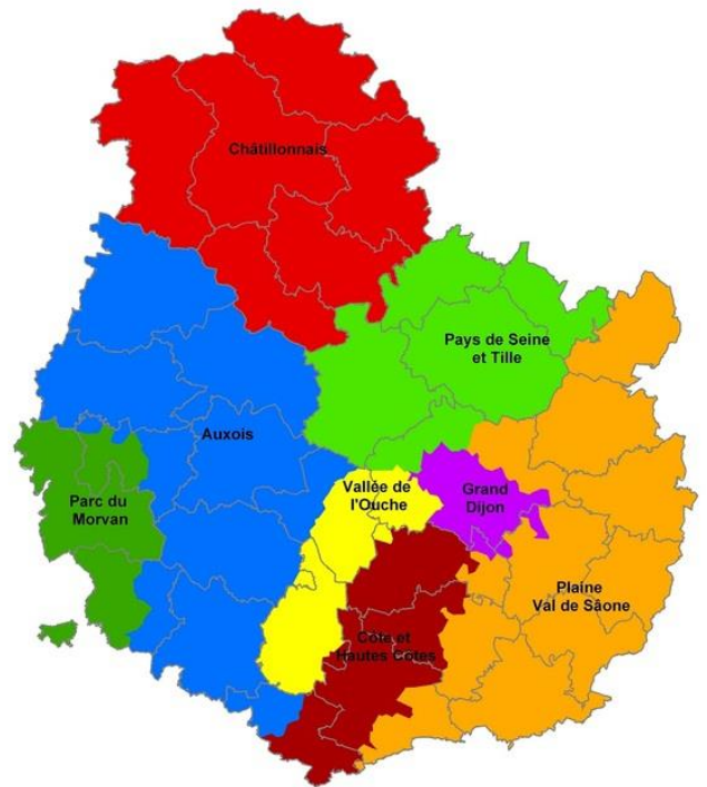
Doc 3 : les espaces naturels en Côte d'Or