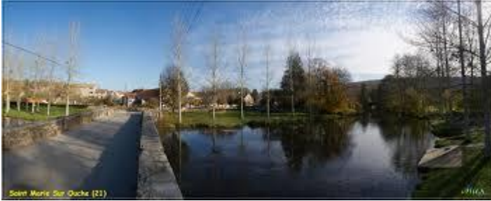
Doc 1 : Vue à Ste Marie sur Ouche