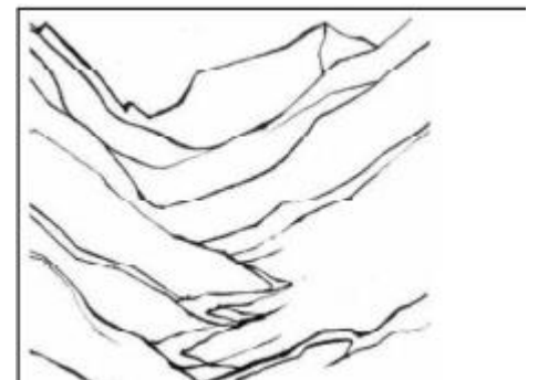
Doc 4 : Coupe d'une vallée