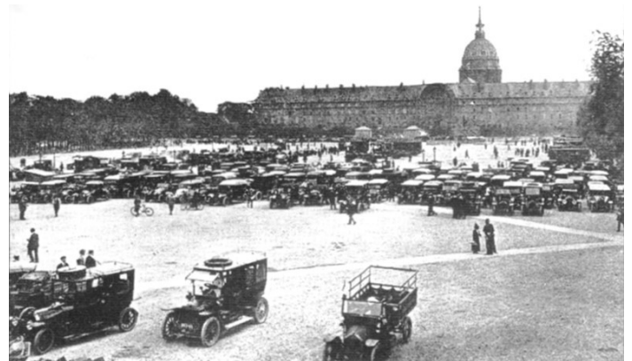
Doc.2 La réquisition des taxis parisiens devant l'hôtel des Invalides, à Paris, 7 septembre 1914.

Lorsque la guerre débute en août 1914, les États européens pensent que celle-ci sera de courte durée. Elle dure en réalité 4 ans et fait 9 millions de morts. L'armée allemande envahit la Belgique et le nord de la France. Elle progresse vite et les Allemands se retrouvent à 40 kilomètres de Paris. Le général Gallieni réquisitionne alors 600 taxis parisiens pour conduire 4000 hommes sur le front*. Les Allemands sont stoppés. Le front se stabilise, c'est le début de la guerre de tranchées .*