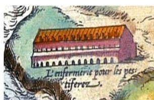
Plan de 1575 : Infirmeries pour les pestiférés.

Un débat, très animé, s'est ensuite concentré sur le « mur des Catalans », vestige du Lazaret édifié dans ce quartier en 1558. Une étude comparative de plans de la ville au fil du temps nous a permis de démontrer que des arcades constitutives d'un des murs de cette « infirmerie pour les pestiférés » (plan de 1575) ont subsisté lors des nombreuses transformations intervenues au cours du temps ; elles étaient encore visibles à l'intérieur de l'usine Giraudon où nous avons pu les photographier, en place, juste avant ce jour de novembre 2018 où les pierres qui les constituaient ont été retrouvées dans une benne du chantier!