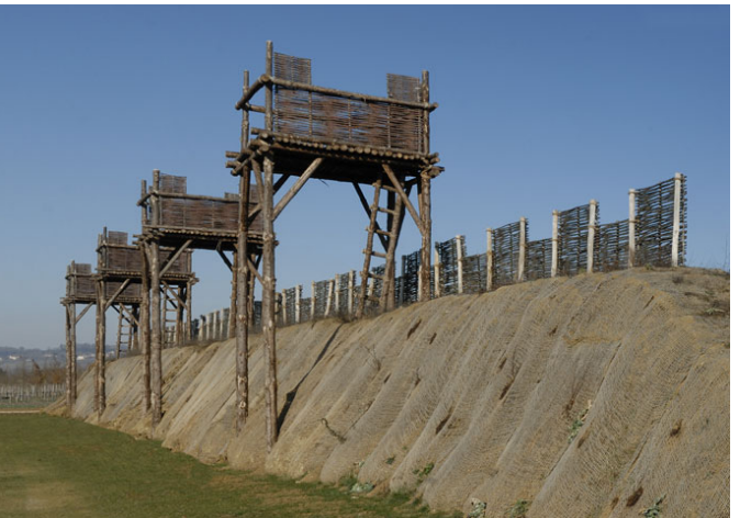
Fortifications édifiées par les Romains autour d'Alésia.

Plutôt que d'attaquer la ville, César décide d'en faire le siège. Il fait construire des fortifications autour de la ville pour empêcher l'armée gauloise de sortir et pour empêcher l'arrivée des renforts. Dans Alésia, on meurt de faim et c'est finalement sans combattre que Vercingétorix devra se rendre à César.