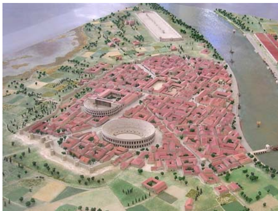
Maquette d'Arles à l'époque gallo-romaine

A partir de cette défaite d'Alésia, les Gaulois deviennent des Gallo-Romains. Peu à peu, ils prennent les coutumes des Romains : les villes vont être transformées selon l'architecture romaine, des édifices (théâtres, thermes, arènes...) sont construits sur tout le territoire, les voies de circulation sont améliorées. Le droit romain est utilisé, on parle le latin. De leur côté, les Romains mettent à profit des inventions gauloises, surtout dans le domaine de l'agriculture.