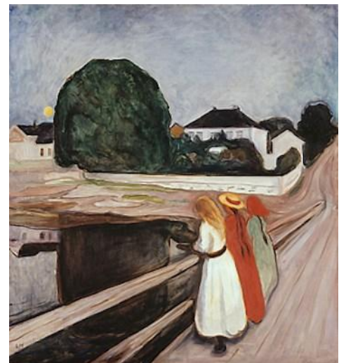
Jeunes fille sur un pont