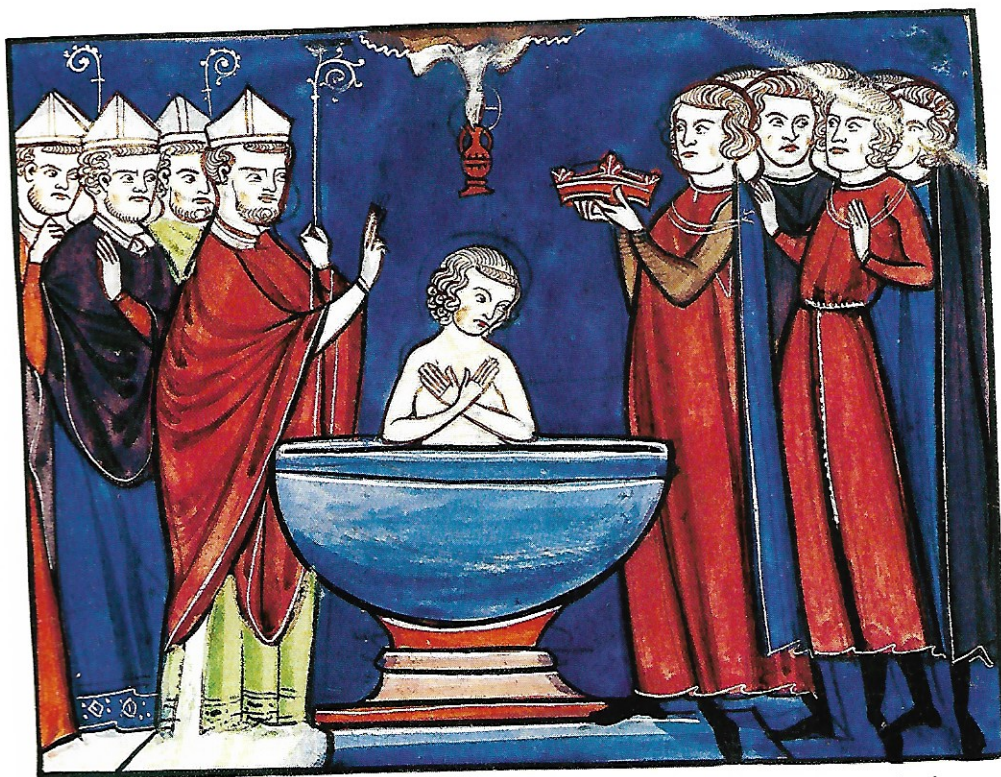
▲ Doc. 1 : Le baptême de Clovis ( Les Grandes Chroniques de France , XIV e -XV e siècles), enluminure.

Clovis se convertit au christianisme vers 496 (Doc. 1 et 2). Ses successeurs forment la dynastie* des Mérovingiens*.