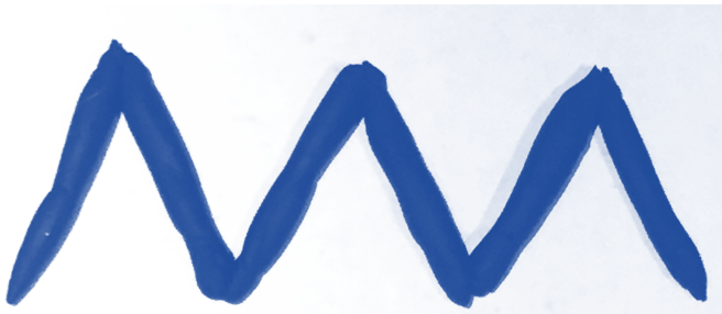
LIGNES BRISEES lignes brisées lignes brisées