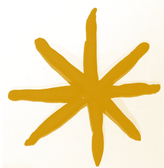
ETOILE étoile étoile