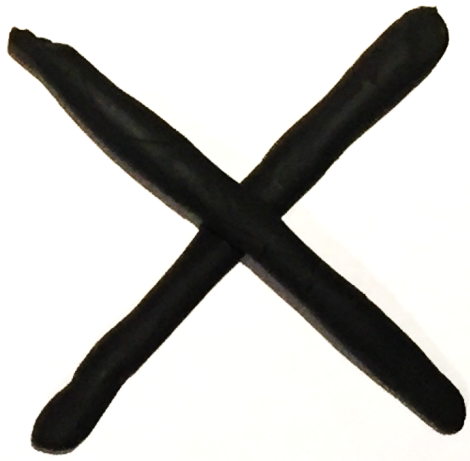
CROIX OBLIQUE croix oblique croix oblique