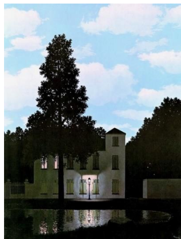
L'empire des lumières