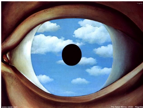
Le faux miroir