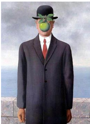
Le fils de l'Homme