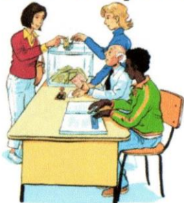
6. L'électeur glisse l'enveloppe dans l'urne.