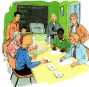
8. Le soir venu, on ouvre les urnes et on compte les voix : c'est le dépouillement.