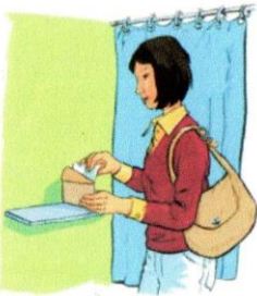
5. En secret, dans l'isoloir, chaque électeur glisse le bulletin nommant le candidat de son choix, dans une enveloppe.