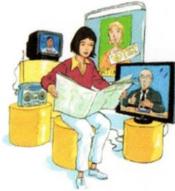
3. Les électeurs se renseignent sur les candidats et leurs programmes.