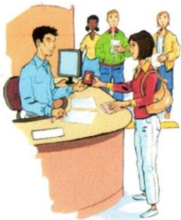
1. Les électeurs s'inscrivent sur les listes électorales.