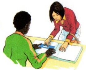
7. Il signe un registre pour prouver qu'il a voté (une seule fois).