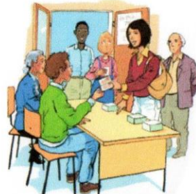
4. Le jour des élections, les électeurs vont à leur bureau de vote et prouvent qu'ils sont inscrits sur les listes électorales.