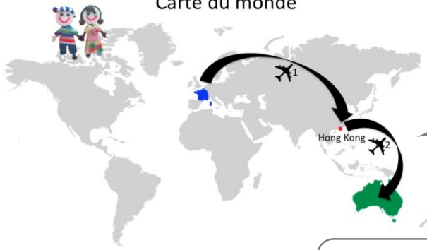
Carte du monde

L'Australie est un pays : la plus grande île du monde.