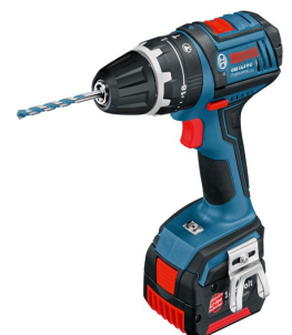
Perceuse électrique Electric drill