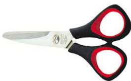
Paire de ciseaux Scissors