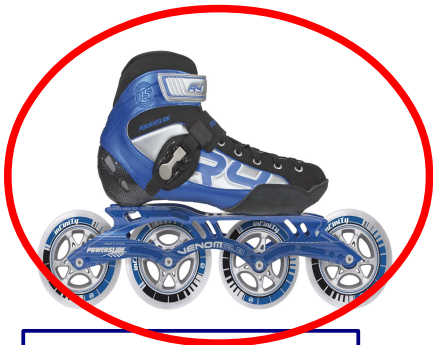
Patin à roulettes Roller