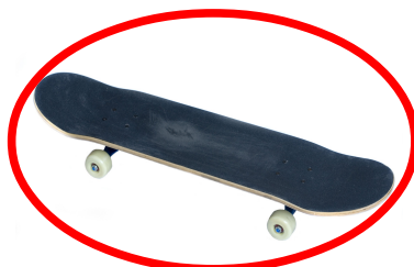
Planche à roulettes Skateboard