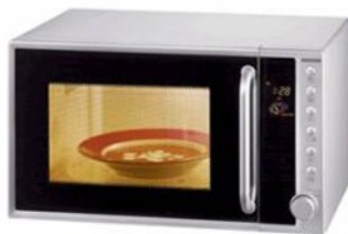
Four à micro-ondes Microwave oven