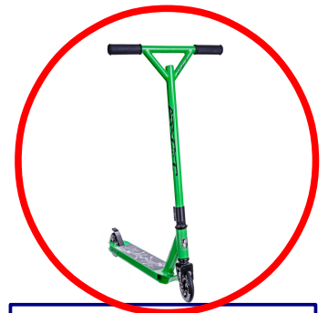
Trottinette Kick scooter