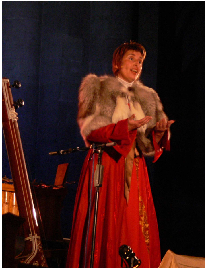
Concert à la cathédrale de Strasbourg 19 décembre 2008

Chant traditionnel persan sur un poème de Hafez (1325 - 1388)