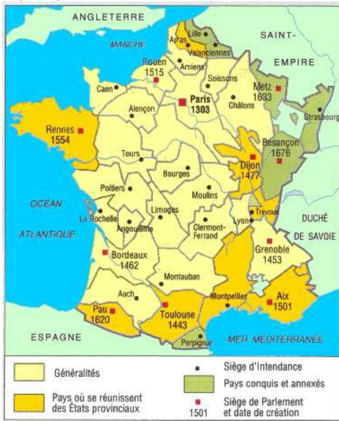
Carte des 22 généralités