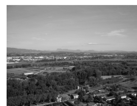
Lo Val de Ròse