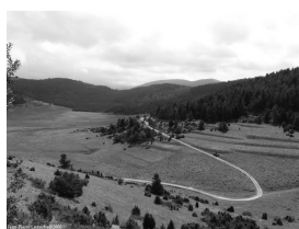
Lo platèu de Belestà