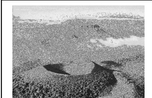
Lo Massís Central