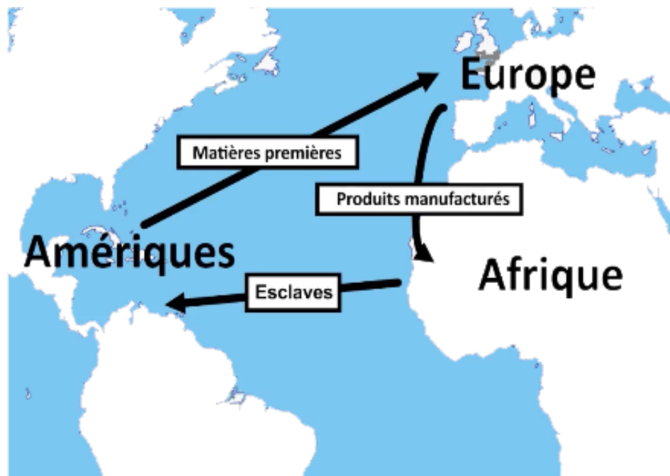
Le commerce triangulaire