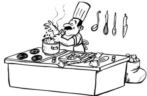
Il cuisine . - Il cuisine .