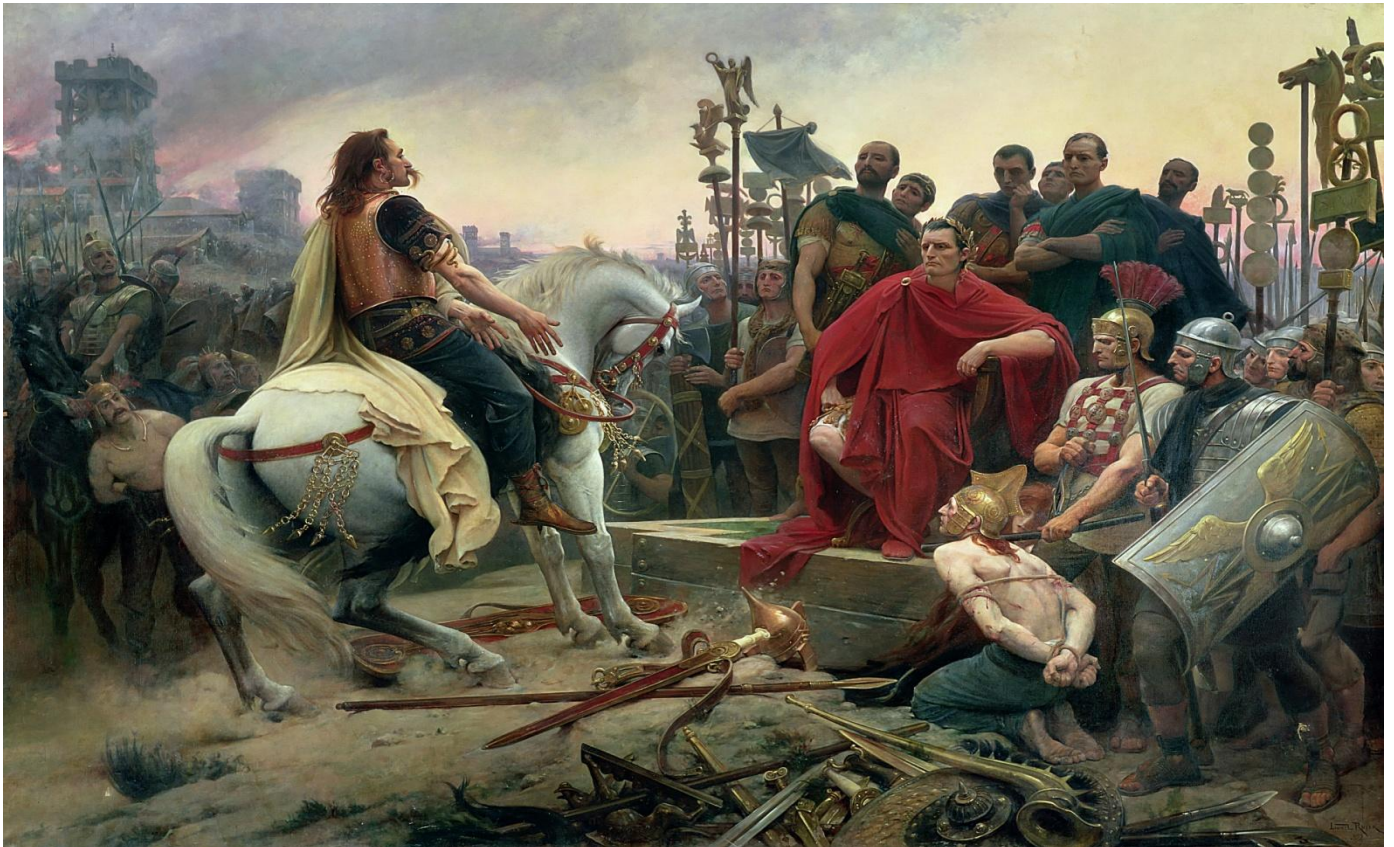
Doc. 1. Peinture de Lionel Royer, Vercingétorix jette les armes aux pieds de Jules César, 1899. Musée Crozatier, Puy-en-Velay, Haute-Loire.

Cette peinture est étudiée en amont en histoire des arts.